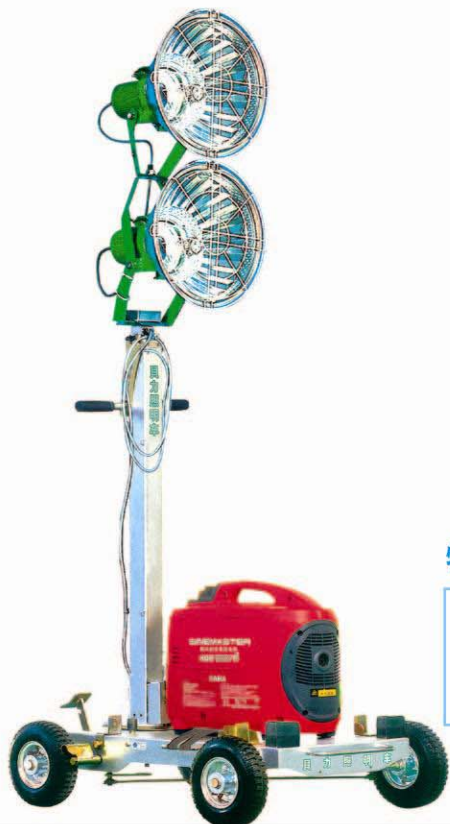
PB420F (折叠型) 400W x 2灯