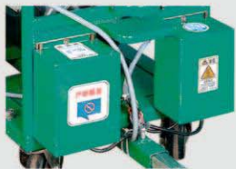
防水防尘型电子镇流器